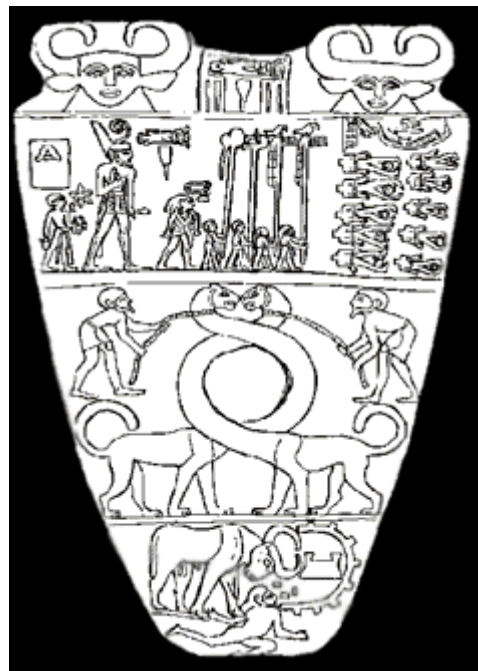
Anverso y reverso de la Paleta de Narmer

En el reverso de la paleta, observamos al “monarca” con la corona del Bajo Egipto (que hace de él neb tawy , Señor de las Dos Tierras) seguido de su porta-sandalias y precedido por una especie de parada militar en la que se muestran diferentes estandartes. Habría también un gran número de cautivos, resultado de su victoria sobre el líder septentrional. En la parte inferior vemos dos fieras cuyos cuellos se enroscan, en una más que probable referencia al proceso de unificación de los dos reinos, el del Alto Egipto gobernado por Narmer y el recientemente conquistado Bajo Egipto. Y, en la base de la paleta, un toro (el que en los textos egipcios clásicos será llamado ka nehet , toro poderoso) simbolizando al monarca, ataca una ciudad y pisotea a su gobernador.