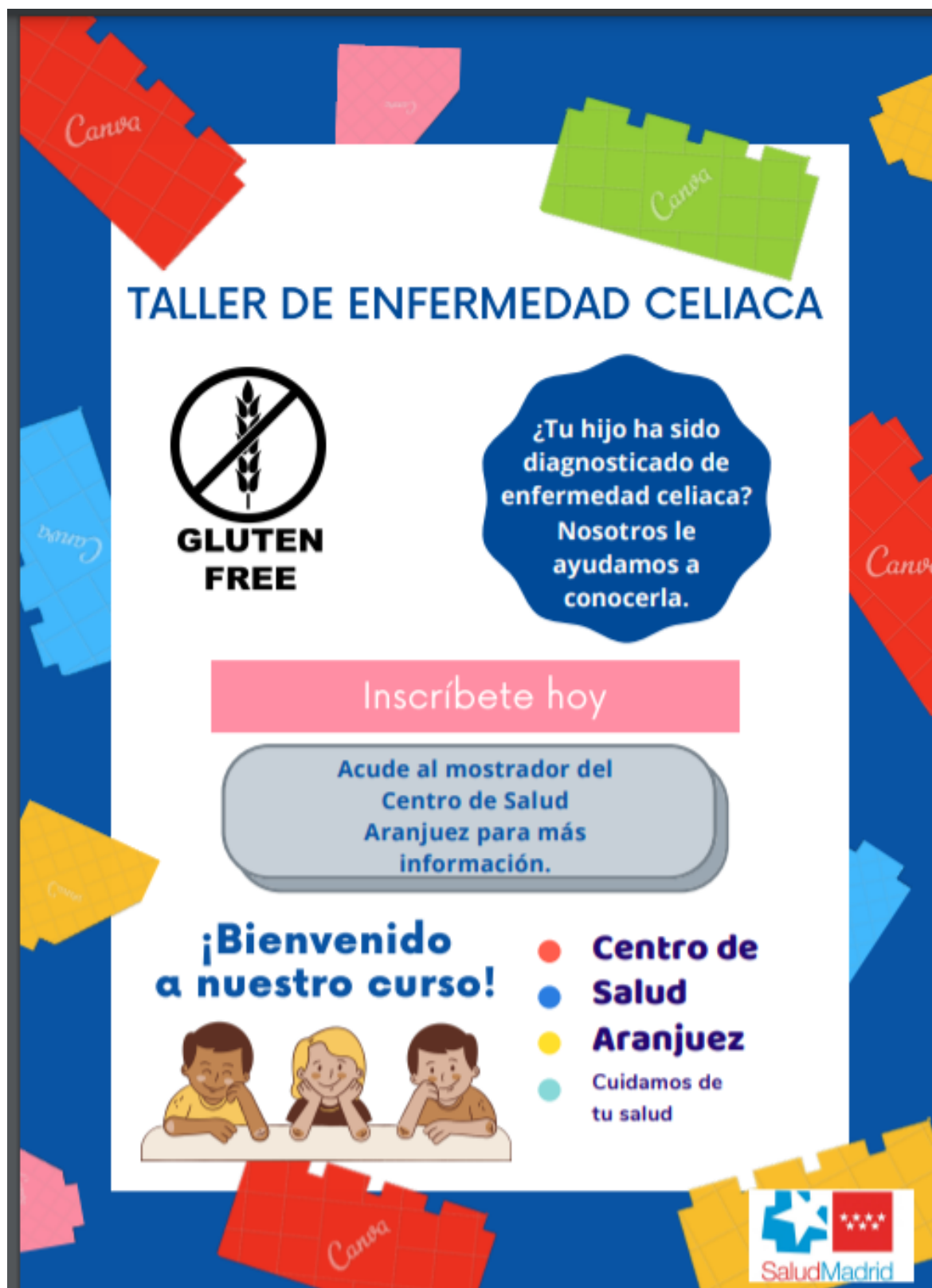
Anexo 3. Póster informativo.